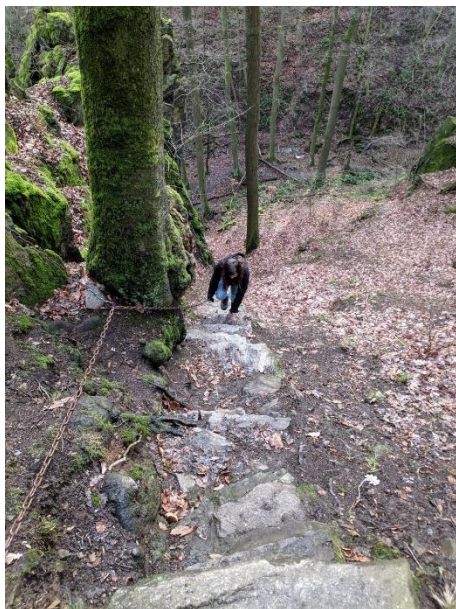
Weg zur Teufelskanzeln

Schwierigkeit: Die Tour ist ca. 5 km lang. Es werden 100 Höhenmeter mit einigen Stufen überwunden. Trittsicheres Schuhwerk ist zu empfehlen!